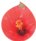
天然セラミドなど 美肌成分を配合