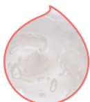
「3重らせん構造」 のコラーゲン