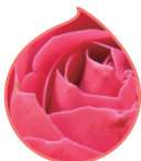
ブルガリアンローズの 艶やかな香り